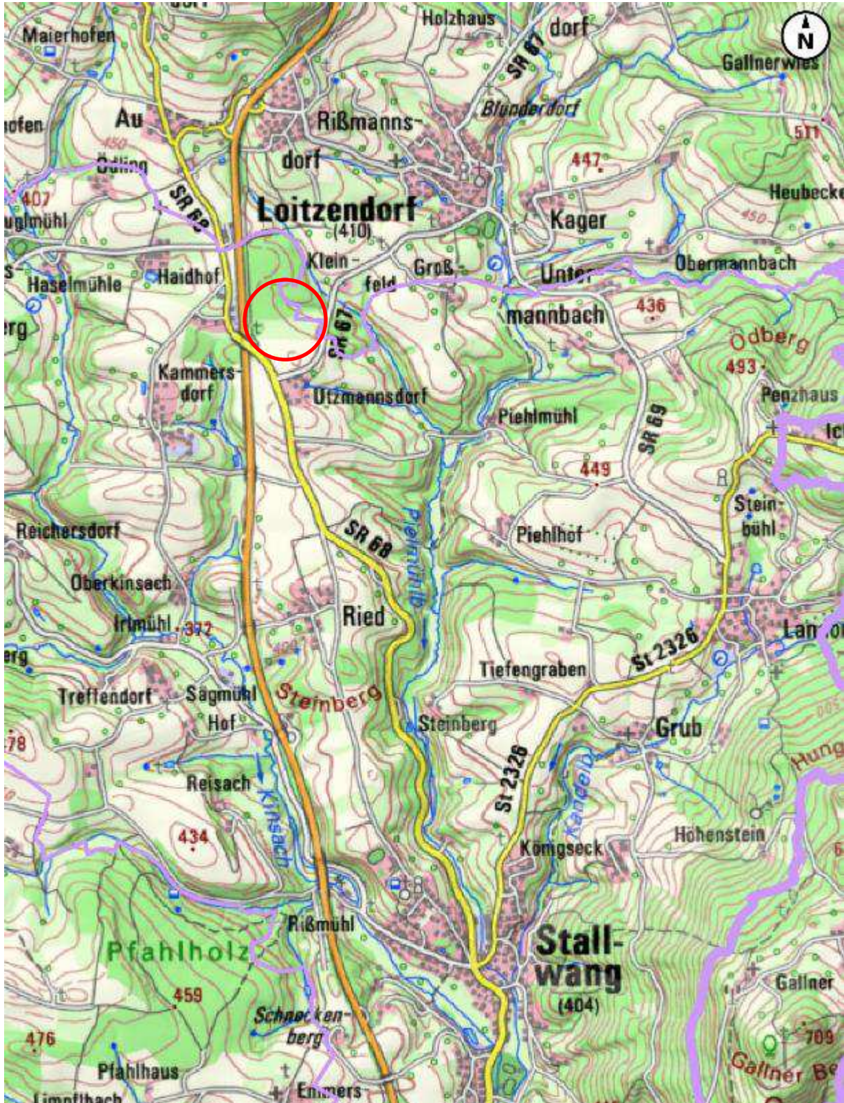
Ausschnitt aus der topografischen Karte des BayernAtlas vom 08.02.2020 – Maßstab ca. 1:25.000