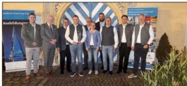
In der Kategorie „Unter-50-Mitarbeiter“ wurde die Firma Muhr geehrt.