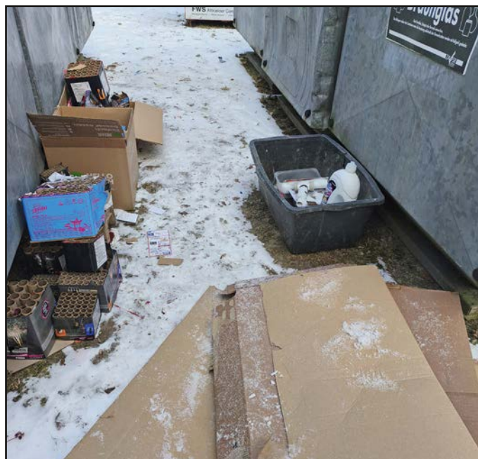
Der Bauhof und die Gemeinde bedanken sich für die wilden Müllablagerungen, am Containerplatz in Stallwang

Nebenbei bin ich noch 1. Kommandant bei der Feuerwehr Schönstein und Jagdpächter des Gemeinschaftsreviers Schönstein.