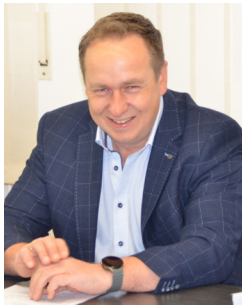
Florian Fuchs 2. Bürgermeister