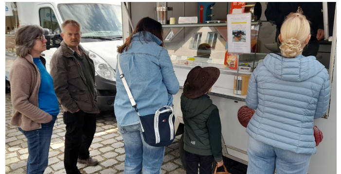
Ein Eis als Nachspeise geht immer