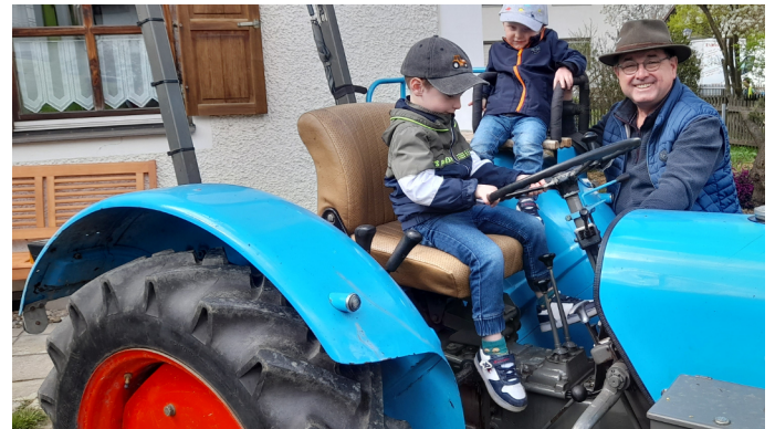
Junge Interessenten auf alten Traktoren