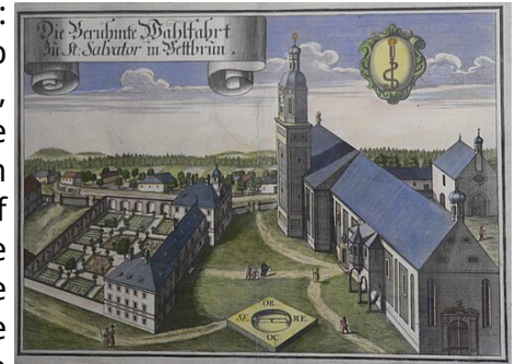
Kirche und Kloster Bettbrunn Kupferstich von Michael Wening